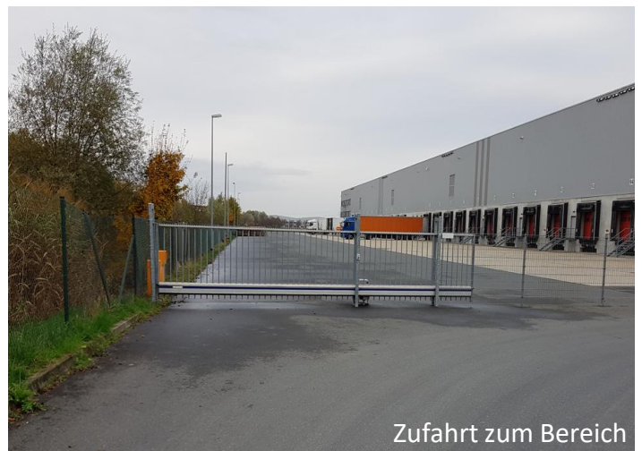
Zufahrt zum Bereich