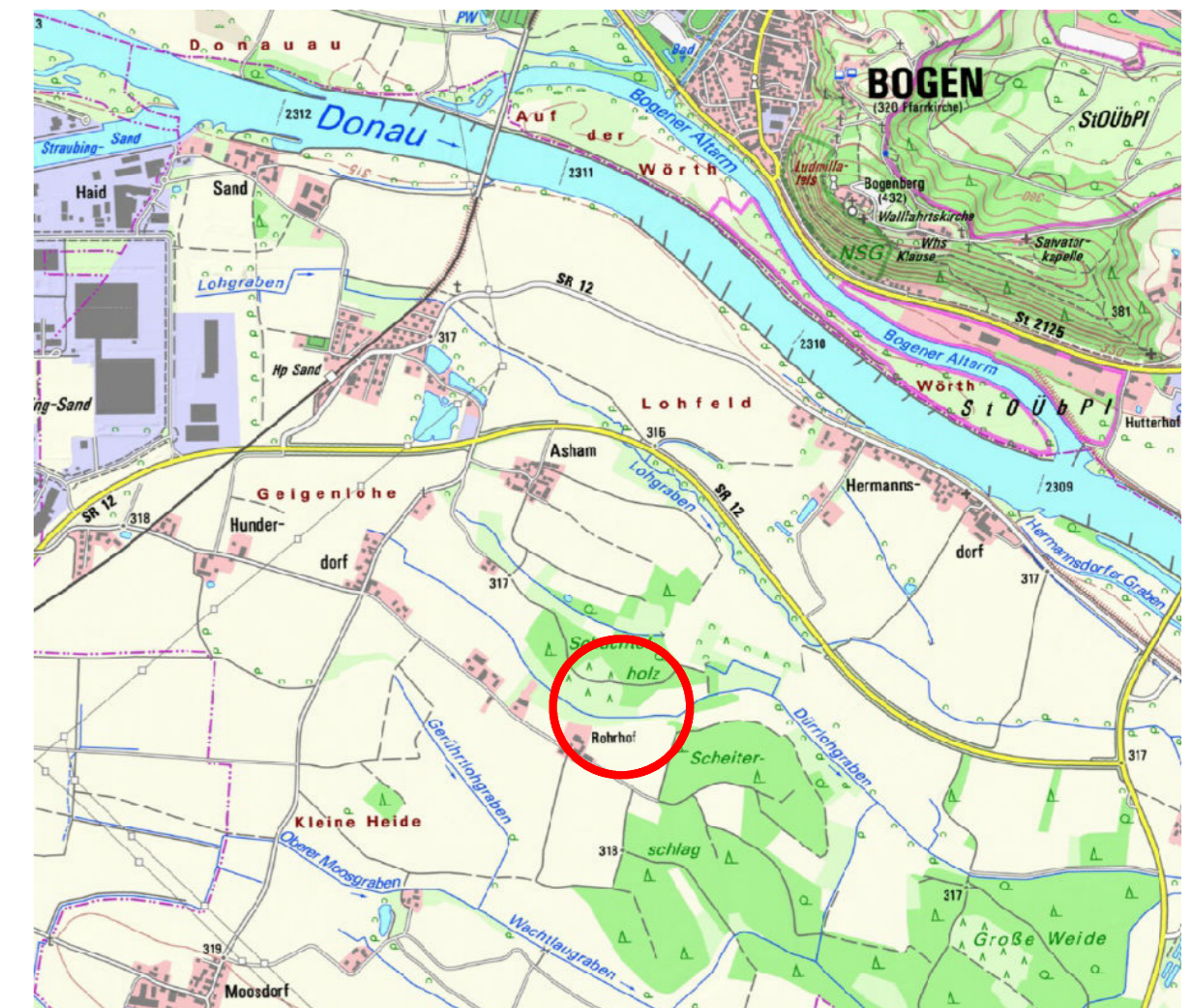
Ausschnitt aus Topographischer Karte des BayernAtlas M 1:25.000